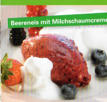
Beereneis mit Milchschaumcreme