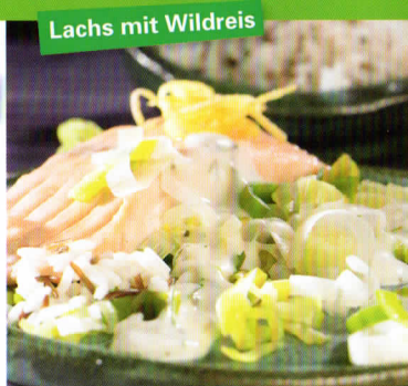
Lachs mit Wildreis