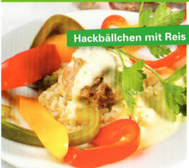
Hackbällchen mit Reis